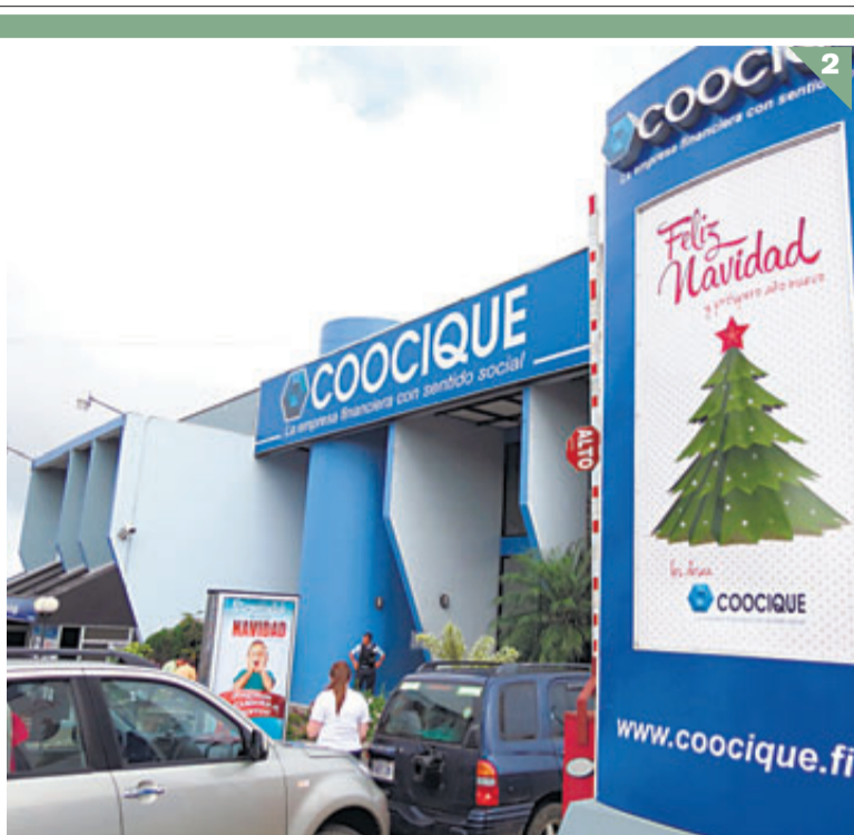
1 - Un grupo de inversionistas locales obtuvo, en noviembre, el 50% de Autos Xiri, que vende carros Peugeot. 2 - Coocique compró Cooperoitina en octubre anterior. 3 - La multinacional Colgate-Palmolive adquirió la firma local Punto Rojo, en diciembre del año pasado. ARCH.