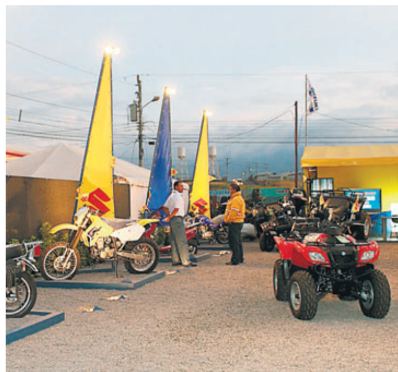
La edición 2014 de Expomóvil incluirá la exhibición de cuadracíclos y la participación de 13 empresas que venden motocicletas.

La propuesta del Banco de Costa Rica (BCR), una de las instituciones participantes, es ofrecer créditos en colones y en dólares, pero incluir planes especiales en moneda